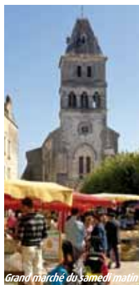
Grand marché du samedi matin