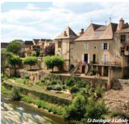
La Dordogne à Lalinde