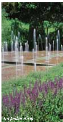
Les Jardins d'eau

A la suite de l'occupation romaine, beaucoup de villes et de villages ont été érigés, consolidés et développés par la seule volonté des rois, du pouvoir religieux ou à l'initiative de seigneurs locaux. Au fil des siècles, les guerres se sont tuées et, lentement, la vie a retrouvé ses droits. Les voies de communication se sont multipliées ; au fil des routes, des rivières, et plus tard grâce au chemin de fer, de proche en proche, artisans et paysans ont pu fonder ces carrefours marchands. Ces lieux d'échanges, humains et commerciaux, bâtis par le peuple, demeurent aujourd'hui. Ces 'villes de la campagne' sont, plus