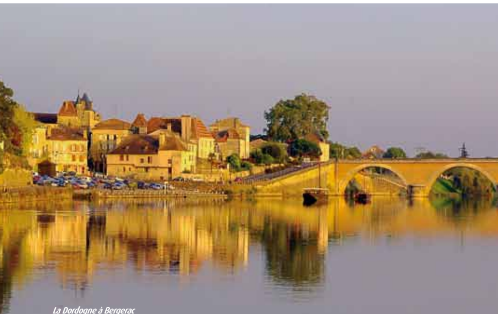
La Dordogne à Bergerac

Bergerac is the fruit of a happy marriage between earth and water. Founded on the banks of the Dordogne, it was a major navigation centre and is still a place to enjoy water sports and barge rides. The gentle river allows the surrounding vineyards to thrive and produce 13 appellation controlled wines. The Maison des Vins in the Récollets Cloister offers wine-tasting classes. Bergerac's history can be read in the remarkably restored old town's narrow streets, where a colourful statue of Cyrano de Bergerac stands amidst half-timbered houses. The endearing figure who sprang out of Edmond Rostand's mind wonderfully symbolises the town's penchant for boldness and generosity.