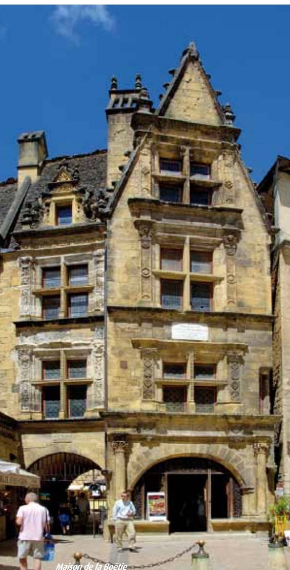
Maison de la Boétie