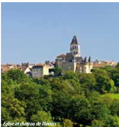
Eglise et château de Thiviers