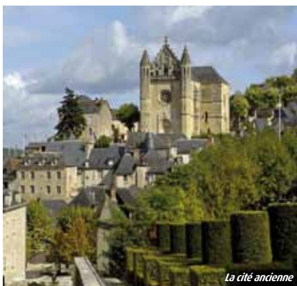
La cité ancienne