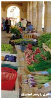
Marché sous la halle