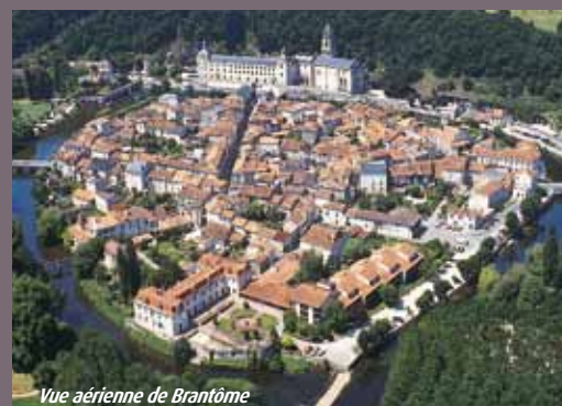
Vue aérienne de Brantôme