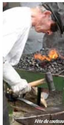
Fête du couteau

Tél. 05 53 56 25 50 - Fax 05 53 60 34 13 - www.nontron.fr - ot.nontron@wanadoo.fr