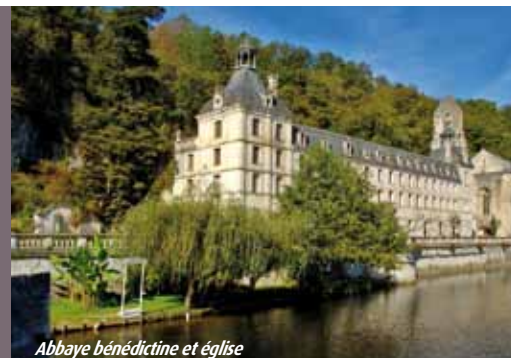
Abbaye bénédictine et église

Mareuil : concours de peinture et de sculpture du 17 au 19 juin.