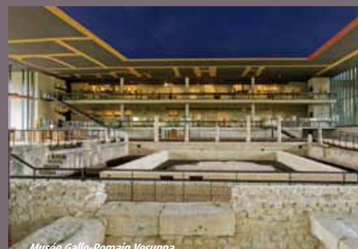
Musée Gallo-Romain Vesunna