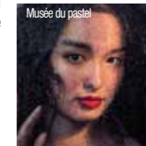
Musée du pastel

Située à l'ouest du Périgord Vert et aux portes de la Charente voisine, la bastide de Saint-Aulaye fondée en 1288 donne à voir ses remparts, son château, son église romane du XI ème et ses ruelles pavées. L'été, vous découvrirez les berges de la Dronne avec sa plage aménagée, son complexe aquatique et sa base de canoë. Vous pourrez également sillonner la légendaire forêt de la Double en suivant les circuits de randonnée. Le marché, regroupant des producteurs locaux, anime le bourg de sa convivialité tous les samedis matins. Visites : Circuit découverte de la Bastide labellisé parmi les 10 plus beaux sentiers du Périgord ; Musée du Cognac et Musée du Pastel ouverts en juillet et août, hors saison sur RDV. Animations : Feu d'artifice le 14 juillet ; marchés nocturnes avec concerts les 15 juillet et 19 août.