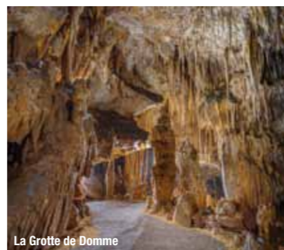
La Grotte de Domme