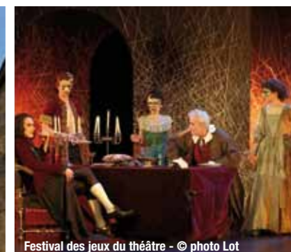
Festival des jeux du théâtre