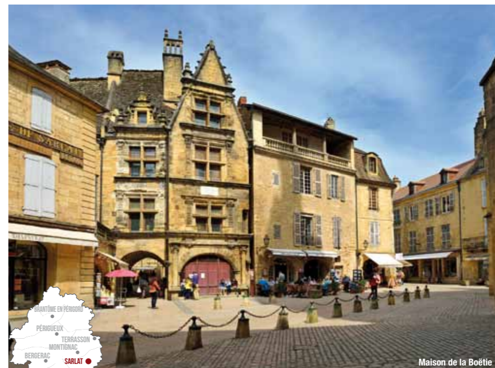
Maison de la Boétie

Demandez le programme, il y en aura pour tous les goûts !!!