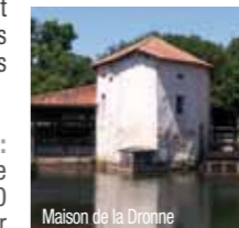
Maison de la Dronne

Guide des hébergements et informations touristiques : Office de Tourisme du Ribéracois - Ouvert toute l'année Place du Général de Gaulle - 24600 RIBÉRAC - C2 - Tél. 05 53 90 03 10 www.perigordriberacois.fr - ot.riberac@wanadoo.fr