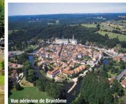
Vue aérienne de Brantôme