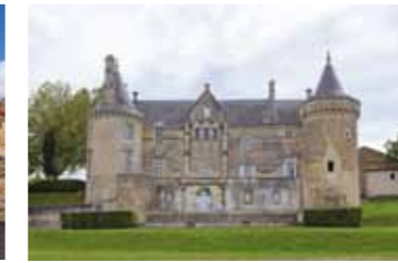
Château de Saint-Aulaye