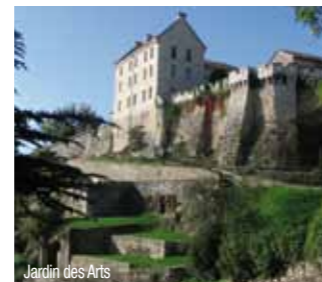
Jardin des Arts

Sa longue tradition coutelière a fait de Nontron sa renommée. C'est une ville chargée d'histoire qui se montre largement ouverte vers l'avenir en ce qui concerne les métiers d'art en Périgord.