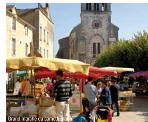
Grand marché du samedi matin