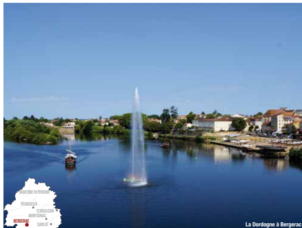
La Dordogne à Bergerac