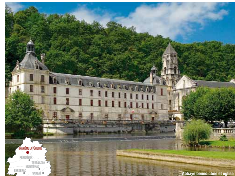
Abbaye bénédictine et église

L'été actif - Pays de Bergerac - Juillet/Août