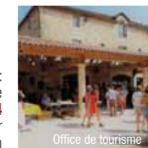
Office de tourisme

Renseignements : Office de Tourisme Périgord Limousin - Ouvert toute l'année 8, place Foch - 24800 THIVIERS - B4 Tél. 05 53 55 12 50 - bit.thiviers@perigord-limousin.fr www.ville-thiviers.fr - www.perigord-limousin-tourisme.com