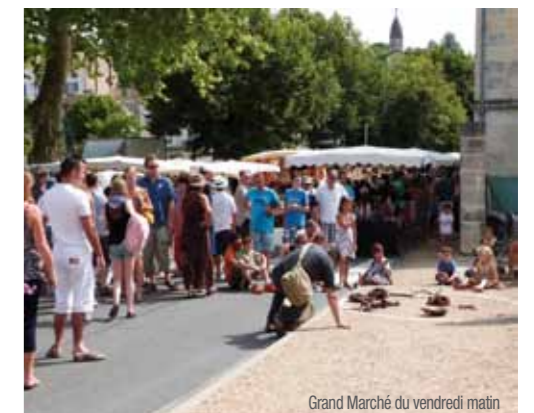
Grand Marché du vendredi matin