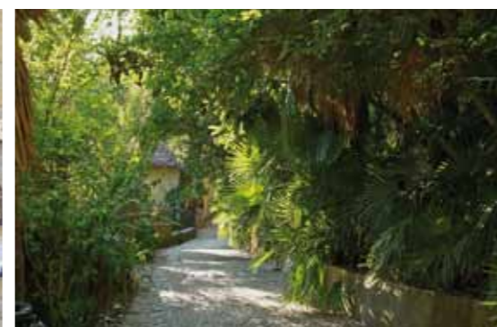
La Roque Gageac