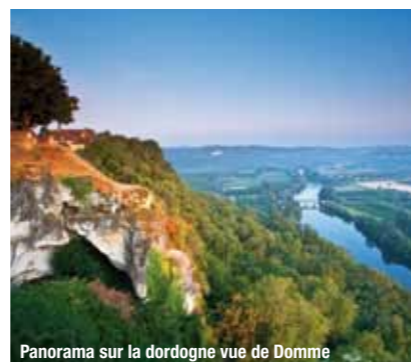
Panorama sur la dordogne vue de Domme