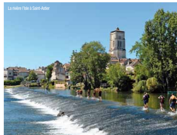
La rivière l'Isle à Saint-Astier

Au cœur de Saint-Astier, au patrimoine historique, le marché du jeudi matin à l'ombre de l'église fortifiée du XI e siècle et des maisons à colombages ou à tourelles, côtoie des équipements de qualité : camping, cinéma, centre culturel, piscine, tennis... Autour, de nombreux châteaux, la chapelle des Bois et le petit patrimoine jalonnent la campagne. Visites : toute l'année, le jeu de piste "Sur les pas d'Asterius" pour découvrir la ville ; en été, circuit en voiture dans les carrières à chaux, parcours thématiques le jeudi ; visites commentées et gratuites de l'église et du clocher. Animations : Au cours de l'été : séances cinéma de plein-air, nuit des bandas, village italien et concerts d'été ! Tout au long de l'année : la fête de la lumière, de la musique ou Défi'Sports et des artistes prestigieux dans le cadre de la saison culturelle. Pour plus d'informations sur les animations et événements, consultez notre site web ou notre page Facebook.