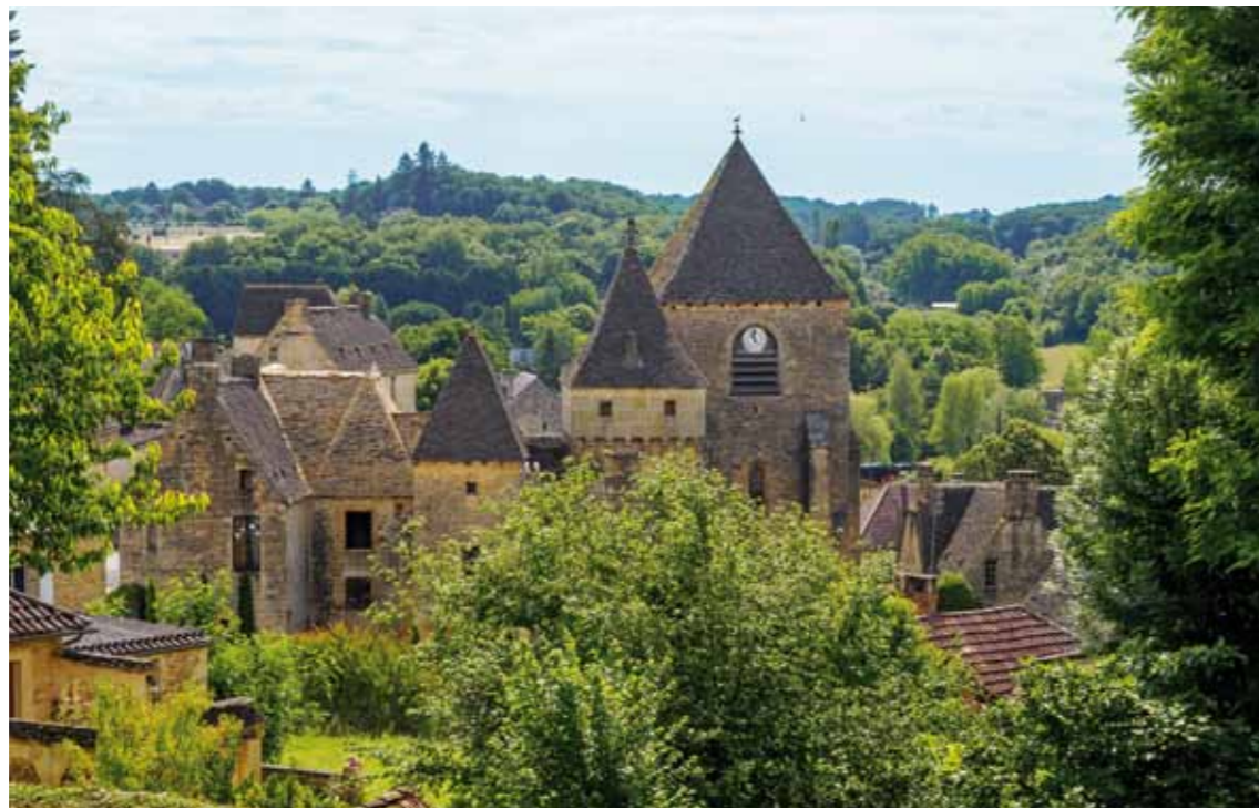
Saint-Geniès et son église