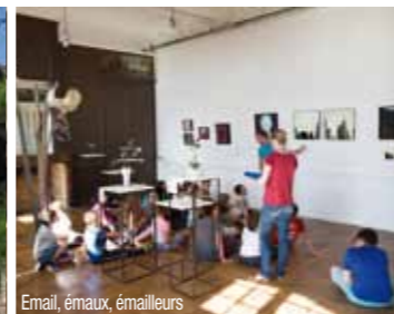
Email, émaux, émailleurs