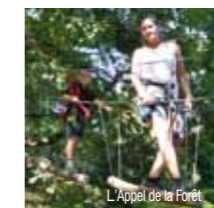
L'Appel de la Forêt

Thenon, située entre la causse et la Vézère au cœur du Périgord Noir, à égale distance de tous les grands et incontournables sites touristiques du Périgord, est une petite ville dynamique avec tous services et commerces. Entourée de forêts, étangs, cours d'eau, collines et champs fleuris ; une généreuse nature parsemée de charmants petits villages plus pittoresques les uns que les autres au riche patrimoine. Visites : le plus grand parc accrobranches de Dordogne «L'Appel de la Forêt». Nombreux sentiers de randonnée à pied, à cheval ou VTT. Détente ou pêche à l'étang communal doté d'une jolie plage avec sa guinguette. A voir : boutiques des artisans d'art de la rue des arts et des saveurs. Animations estivales : Marchés de Producteurs de Pays le mardi (avec repas festifs), concerts à la guinguette de l'Etang tout l'été, fête patronale le 1 er WE de juillet. Balades botanique contées les vendredis. Retrouvez l'agenda complet sur vezere-perigord.fr