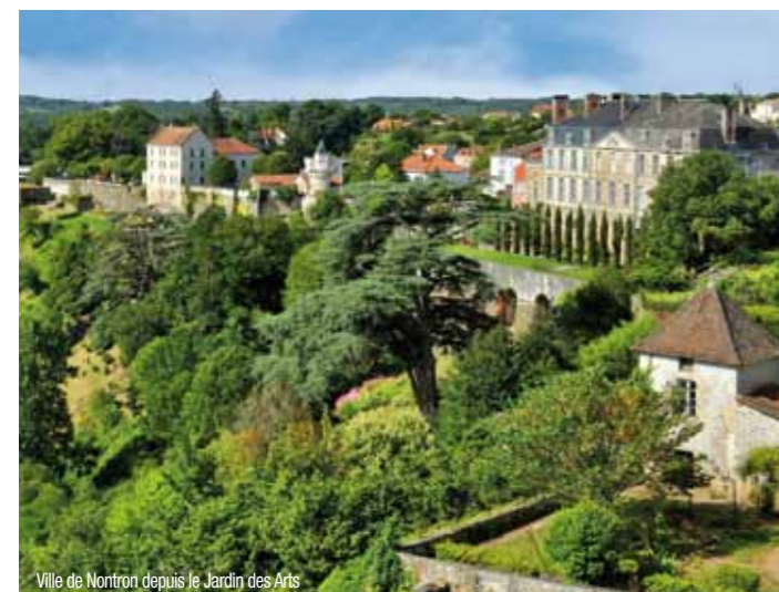
Ville de Nontron depuis le Jardin des Arts

Aux portes de la Charente et de la Haute-Vienne, cette petite cité coutelière ("Ville et Métiers d'Art" depuis 2006), offre de magnifiques points de vue sur la vallée du Bandiat. Grâce à son savoir-faire artisanal : la coutellerie, les métiers d'art et du luxe, elle est connue dans le monde entier. Visites : Visites commentées de la ville les mercredis en été, centre aquatique, cinéma, plan d'eau, sentiers de randonnées. Animations : 27 e Fête du Couteau les 5 et 6 août, marchés de producteurs de pays nocturnes en juillet-août, Rue des Métiers d'Art en octobre. Calendrier des manifestations, "Été Actif", jeu de piste, brochure des hébergements et guide touristique disponibles à l'office de tourisme.