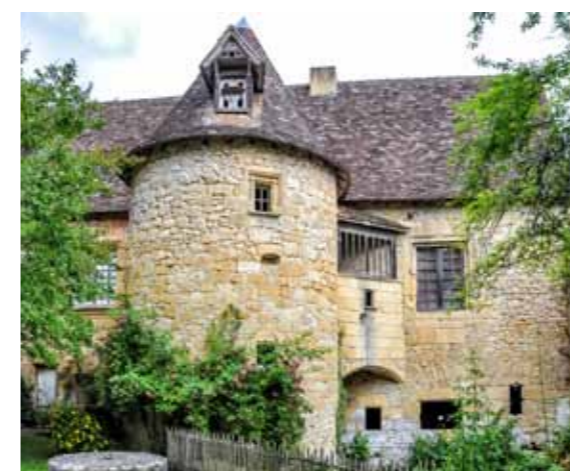
Moulin de La Rouzique - Couze-et-Saint-Front

"As happy as God in France!" goes a German adage about the gentle pace of life here. So many people have indeed chosen to settle here, over such a long period of time, that we could add, "And as happy as men and women in Périgord!" Périgord is indeed in the perfect spot – on the 45 th parallel – explaining its superb temperate climate. Nature has sheltered people here for nearly 400,000 years now. The shelters and decorated caves in the Vézère River valley – including Lascaux, one of the best-known examples worldwide – are the earliest signs of the artistic and spiritual insights that stirred our now well-known-ancestors. The Romans called the people in this county they had recently conquered Petrocores. That is where the name Périgord came from. And human invention has not stopped enriching this area's now seemingly limitless treasures since. The churches here bear Romanesque art's unmistakable hallmarks. The Hundred Years' War in the Middle Ages brought fierce clashes between the Kingdom of France and the English Crown – and bequeathed this area the imposing fortresses and beautifully-kept fortified towns you can explore and enjoy today. The Renaissance brought peace, ushered out gothic architecture, and ushered in beautiful homes that rank on a par with the Loire Valley chateaux. The centuries that followed enriched this area with countless influences. History's periods intertwine endlessly here today.