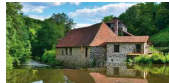
Forges de Savignac-Lédrier