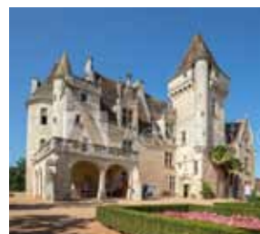
Château des Milandes

Idéalement placé sur le 45 ème parallèle, le Périgord est l'exemple parfait du climat tempéré. Depuis près de 400 000 ans, les ressources de la nature ont permis l'épanouissement humain ; les abris, les grottes ornées de la vallée de la Vézère, dont la plus illustre est la grotte de Lascaux, sont les premiers signes de la vocation artistique et spirituelle de nos prestigieux ancêtres. L'époque romaine a baptisé les habitants de cette nouvelle contrée conquise, « Petrocores » qui donna plus tard son nom au Périgord. Depuis lors, les traces de l'invention humaine n'ont cessé d'enrichir cet inépuisable patrimoine. L'art roman s'est exprimé à travers la réalisation de nombreux édifices religieux. Au Moyen Âge, la guerre de cent ans, durant laquelle notre territoire fut le siège d'âpres luttes entre le royaume de France et la couronne d'Angleterre, a laissé d'impressionnantes forteresses et des bastides magnifiquement préservées. Durant la Renaissance, la paix retrouvée, le Gothique finissant a laissé place aux constructions de plaisance comparables aux châteaux de la Loire. Les siècles suivants ont poursuivi la construction de ce pays où les époques se mêlent pour l'éternité.