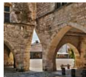
Bastide de Montpazier